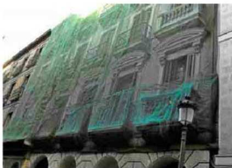
La remodelación de vivienda presenta oportunidades de empleo.